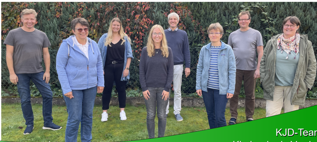
KJD-Team Kirchenkreis Verden